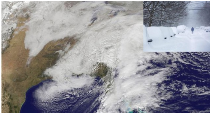
Schneefront an der Ostküste

Der Schnee weiss vermutlich von den Latif-Ankündigungen nichts und Frau Merkel blieb irrtümlicherweise auf dem Boden. Wenigstens eine, wenn auch anders.